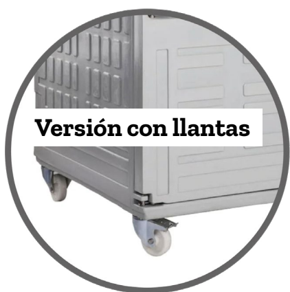
Versión con llantas