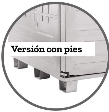
Versión con pies